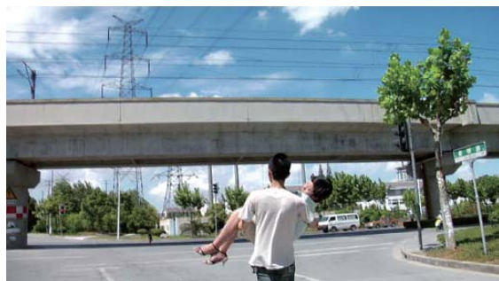
宋涛《我美丽的张江》。